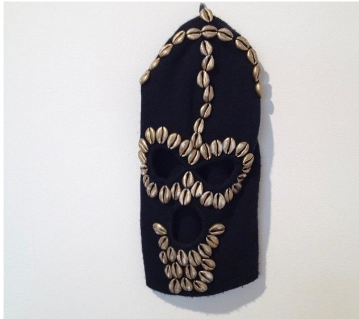
laut Bildunterschrift dient die Maske des Königs der Kauris dem Wiedererobern des afrikanischen kulturellen Erbes 12

Ich glaube, die Zahlen sprechen für sich selbst. So viele unproduktive Ausgaben!