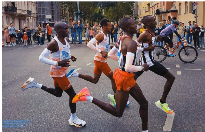
der Hinterste der vier ist Eliud Kipchoge, wohl der Allzeitbeste unter den vielen exzellenten LangstreckenläuferInnen unter den Kalenjin 9

Die Aufhebung des Mau Mau-Verbots geschah 2003, da war Mwai Kibaki kenianischer Präsident. In ihn waren große, ja riesige Hoffnungen gesetzt worden. Endlich war Daniel arap Moi Geschichte, nun würde es mit Kenia endlich aufwärts gehen und es würden nicht nur Kalenjin – die Ethnie, der Moi entstammte – Zugang zu staatlichen Futtertrögen haben.