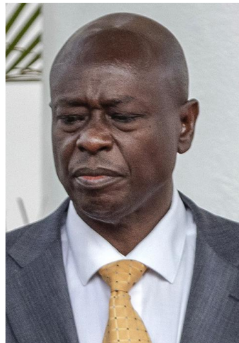
Rigathi Gachagua, damals Rutos Vize 39

Und 2007/08, bei den auf die Wahlen folgenden Ausschreitungen, spielten sie eine wesentliche Rolle.