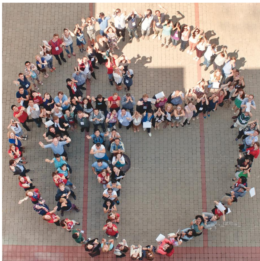
hier haben Menschen in Litauen das Logo von Transparency International nachgebildet 1