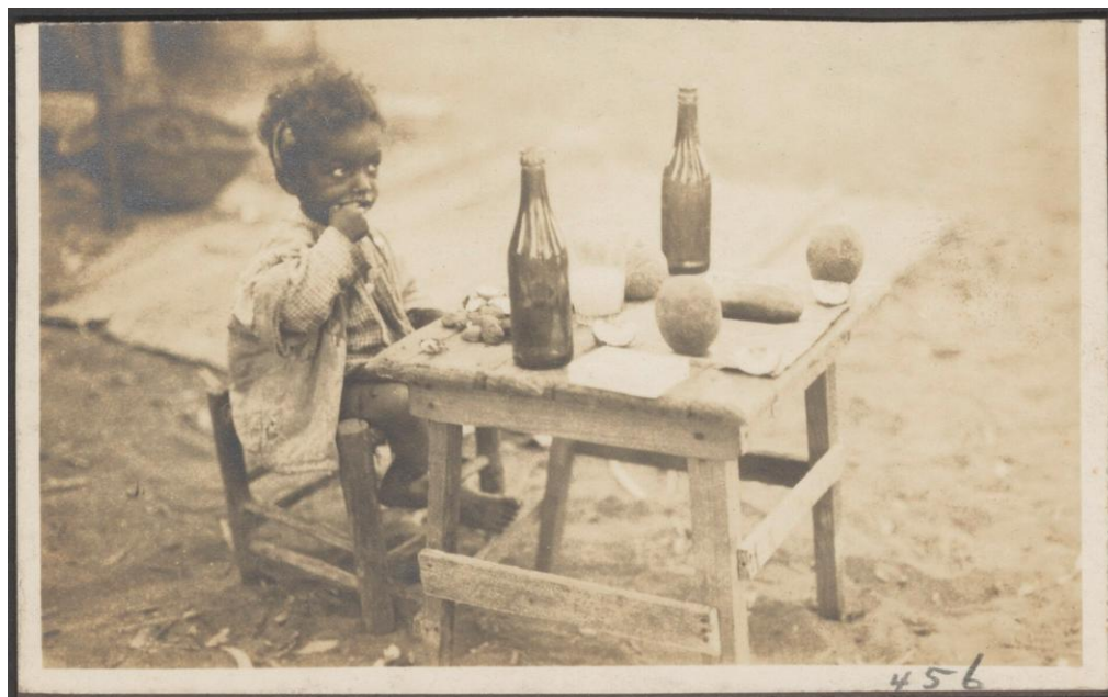
kleines Kind an kleinem Tisch, essend 1