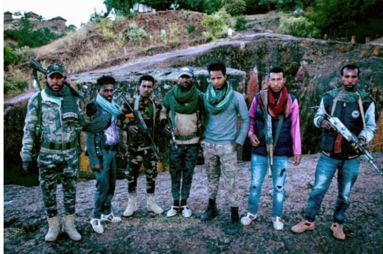
Mitglieder der Fano-Miliz in der Nähe von Biete Ghiorgis, der Georgskirche, einer der elf Felsenkirchen Lalibelas 5

https://theconversation.com/ethiopia-votes-dominant-ruling-party-seeks-a-new-mandate-in-a-deeply-fragmented-nation-283783