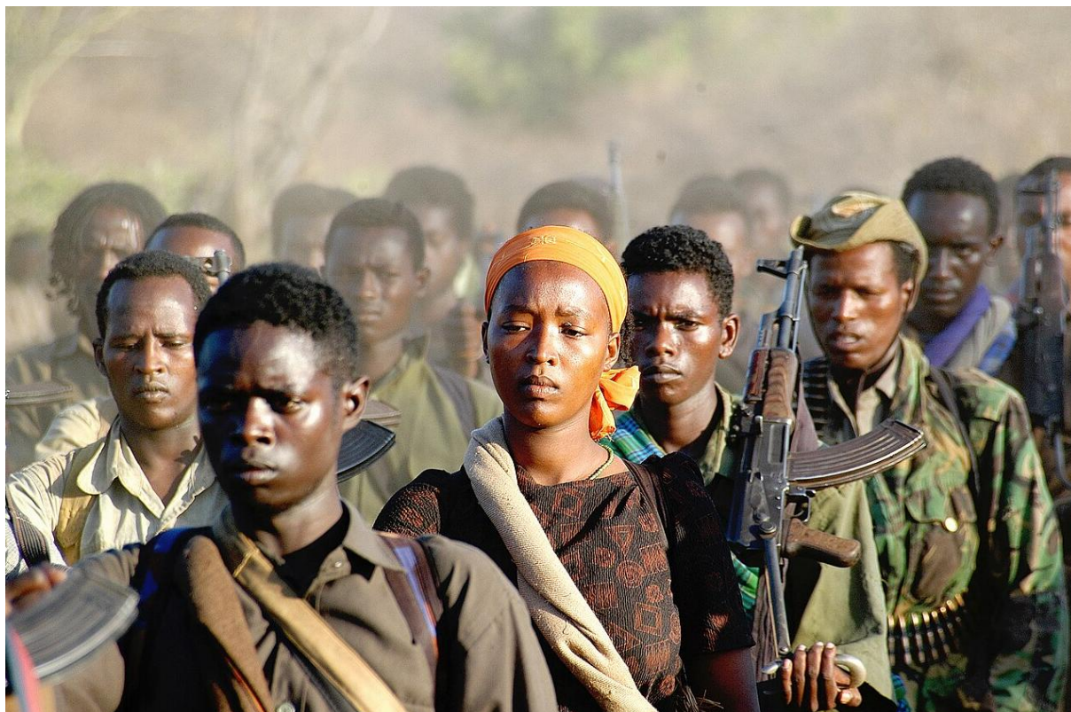
Mitglieder der OLF, der Oromo-Befreiungsfront 1